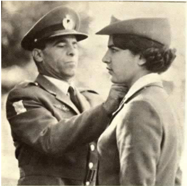
نماینده دوشیزگان هنرجو پس از طی دوره آموزش نظامی به اخذ سردوشی از دست فرمانده "فرماندهی آموزشهای هوایی" مفتخر میگردد.