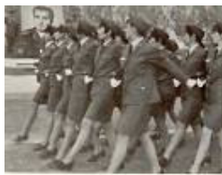
۱۳۰۴ زن و دوشیزگان هنرجو از برای جشن تاجگذاری شاهنشاهی